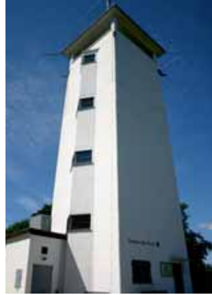
Turm am Volkmarsberg