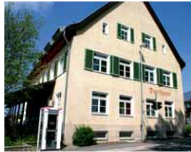
Das Dorfhaus in Bartholomä

Los geht's am Dorfhaus Bartholomä (645 m ü. NN). Zunächst queren wir die Beckengasse rechts vorbei an der katholischen zur evangelischen Kirche und gehen dann die Amtsgasse hinab zur Hauptstraße, wo wir dem Wanderweg des Schwäbischen Albvereins mit der Markierung gelbes Dreieck [▲] folgen. Wir benutzen nun links den Wentalweg bis zum Jugendhaus und der Gedenkstätte „Drei Steine“. Vor dem Waldrand halten wir rechts ins Obere Wental, in dem wir durch das bekannte Felsenmeer in Richtung Steinheim wandern. Unser weiterer Weg lässt uns die durch Wasserkraft entstandenen bizarren Felsformationen des Tales bestaunen. Beim „Landhotel Wental“ überqueren wir die Landstraße und wandern weiter, dem gelben Dreieck [▲] folgend, durch das nicht minder geheimnisvolle „Untere Wental“, das den Spitzbubenstadel, das Rondell, die Ruinen oder die Sphinx beherbergt. Bei der Wegkreuzung besteht die Möglichkeit, die Abkürzung zum Bibersohl zu wählen, wo wir wieder zum Hauptweg kommen. Gleich nach dem wohl markantesten Felsen des Trockentales, dem „Wentalweible“, lädt die Wentalshutzhütte [ab hier ◀] zu einer Rast ein, bevor es weiter geht bis