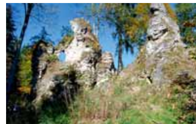
Felsformation im Wental