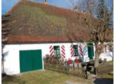
Forsthaus in Bibersohl

Sie können bei tour 4 auch eine andere Streckentour planen, dazu gehen Sie nach dem Staudamm links [◀] am mächtigen Hirschfelsen vorbei bis nach Steinheim und organisieren eine Rückfahrt nach Bartholomä.