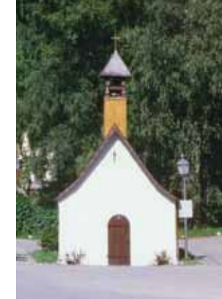
Die Wendelin-Kapelle in Beuren liegt am Jakobsweg

Brücke überquerend zur Brühlstraße. Dieser folgen wir nach rechts und gehen am Ende den Fußweg gerade aus. Nachdem wir die Beurenstraße überquert haben, folgen