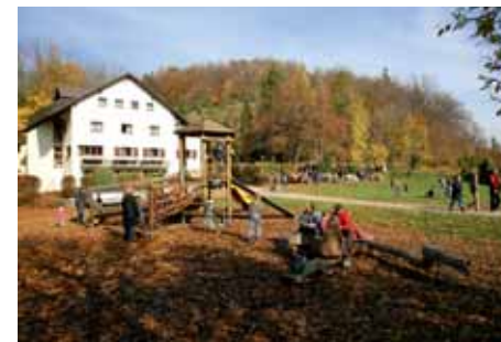
Naturfreundehaus auf dem Himmelreich

In der Scheuelbergstraße in Heubach geht es sodann zwischen dem Haus Nr. 37 und Nr. 35 rechts ab, einen Fußweg und kleine