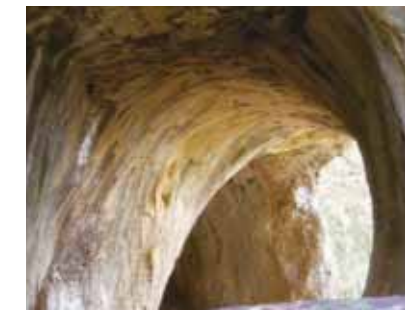
Die Große Scheuer

Vom „Finsteren Loch“ führt ein schmaler Wanderpfad hinunter nach Lautern, der aber nur für geübte Geher geeignet ist und bei nassem Wetter für Wanderer erhebliche Rutschgefahren birgt. Wir wählen daher den leichteren Weg und wandern von