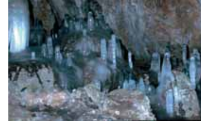
Höhlen auf dem Rosenstein mit Eiszapfen

Waldschenke: Durstige und hungrige Wanderer finden dort alles, was sie zur Labung brauchen. Von dort geht es auf kurzem, etwas steilem Weg etwa 500 m zurück. Jetzt biegen wir links [↔] ab, steigen kurz eine kleine Böschung hinauf und wandern auf einem herrlichen Waldweg bis zum Ostfelsen vor [↔]. Unterwegs sollte der Wanderer nicht versäumen, immer wieder die Aussichtspunkte anzusteuern: Die Blicke ins Tal sind es wert. Auf dem Weg zum Ostfelsen kommen wir an der „Großen Scheuer“ und dem „Haus“ vorbei. Nach kurzem, mit Drahtseilen gesichertem Abstieg, erreichen wir diese Höhlen, deren Größe immer wieder überrascht. Wenn der Blick vom Ostfelsen hinunter nach Lautern, hinüber zum Pfaffensturz und nach Lautern ausgiebig genossen wurde, folgen wir dem Schild [↔] „Zum Finsteren Loch“ ein kurzes Stück. Nach etwa 500 m gabelt sich der Weg, links geht es zum „Finsteren Loch“, eine Höhle, die nur noch selten begangen werden darf, da sie vielen Fledermäusen Unterschlupf und Winterquartier bietet.