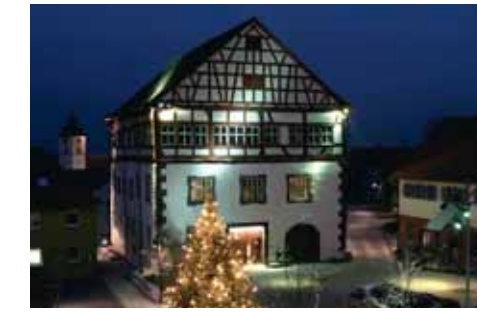
Schloss in Heubach

der Wegegabelung rechts weiter, kommen an der Alpenvereinshütte vorbei und erreichen wiederum eine Wegegabelung: Rechts geht es zur Ruine Rosenstein, geradeaus führt der Weg zum „Stock“. Wir wählen den linken Fahrweg, [↔] der durch das Lappertal nach Lautern hinunter führt. In Lautern geht der Weg an der Gärtnerei Deininger vorbei. Nach etwa 200 m biegt ein Feldweg rechts ab, der zum Waldrand führt. Nach Erreichen des Waldrandes biegt der Weiterweg scharf links ab. Wir wandern durch das Wäschbachtal bis zur Abzweigung nach Lautern. Dort überqueren wir den Bach auf einem kleinen Steg und erreichen auf einem schönen Waldweg den Ort und den gut erhaltenen Eingangsbereich des Schlosses Lautern. Die Ruine kann leider nicht besichtigt werden, da teilweise Einsturzgefahr droht. Sehenswert ist dort auch die evangelische Kirche. Weiter geht es [▶], vorbei an der Bäckerei Maier, den Gänsberg hoch. Von hier oben lassen wir nochmals unseren Blick hinüber zum Ostfelsen des Rosensteins und hinunter nach Lautern und Lautern schweifen, ehe wir den im Süden gut zu erkennenden Bärenberg auf dem Grünen-Plan-Weg ansteuern. Vor dem Wald gehen wir links ab und lassen uns sicher von den Bärenberg-Rundwanderschildern zum Ausgangspunkt Bartholomä zurück leiten.